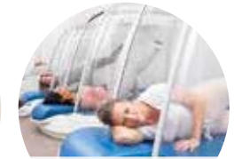
bewegingstherapie in warmte