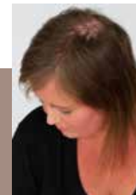
voor T Parting

Neem voor het maken van een afspraak of meer informatie over knippen, kleuren, föhnen, haarwerken of T Parting gerust vrijblijvend contact op.