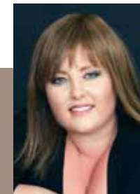
na T Parting