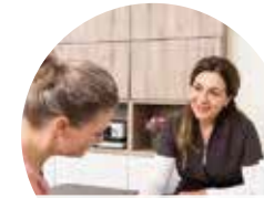
energiemeting & voedingsadvies